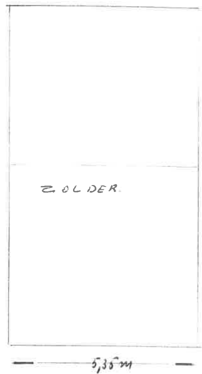
zolder (geen kamers)